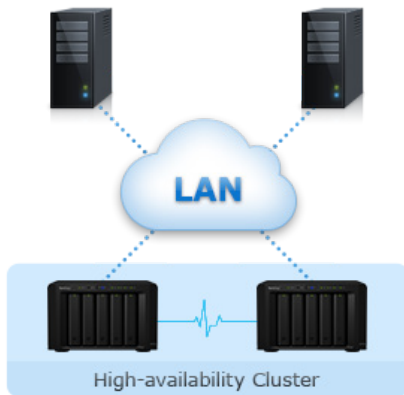
Abbildung 1) Zuverlässigkeit, Verfügbarkeit & Wiederherstellung

Synology High Availability stellt den nahtlosen Wechsel zwischen zwei Cluster-Servern mit minimalen Auswirkungen auf Unternehmen sicher, falls ein Serverausfall auftreten sollte.