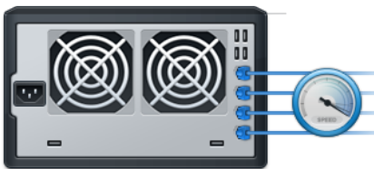
Abbildung 2) Erstklassige Leistungsfähigkeit

Synology High Availability stellt den nahtlosen Wechsel zwischen zwei Cluster-Servern mit minimalen Auswirkungen auf Unternehmen sicher, falls ein Serverausfall auftreten sollte.