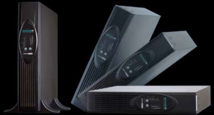
XANTO RT 1000 als Tower und in Rack-Montage

In Verbindung mit der geregelten Lüftereinheit ist so eine neue USV-Klasse entstanden. Sie überzeugt durch nahezu geräuschlosen Betrieb . Auch in Büroumgebungen ist die XANTO RT -Serie somit uneingeschränkt einsetzbar.