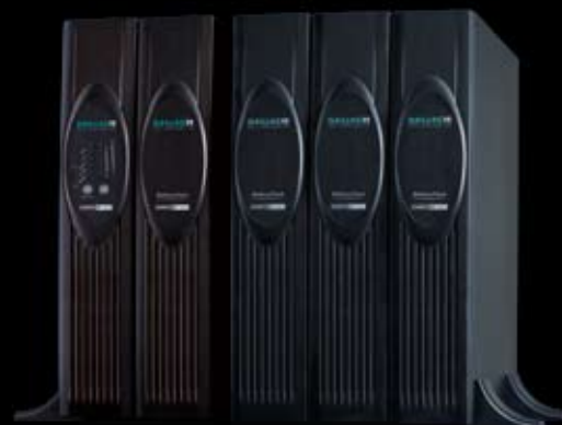
XANTO RT 3000 in der maximalen Ausbaustufe