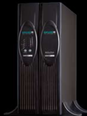
XANTO RT 2000 in der Grundkonfiguration