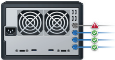
Abbildung 2) Belastbar und zuverlässig

Mehrere LAN Ports mit Link Aggregation Unterstützung ermöglichen der DS1513+ eine hervorragende Leistung.